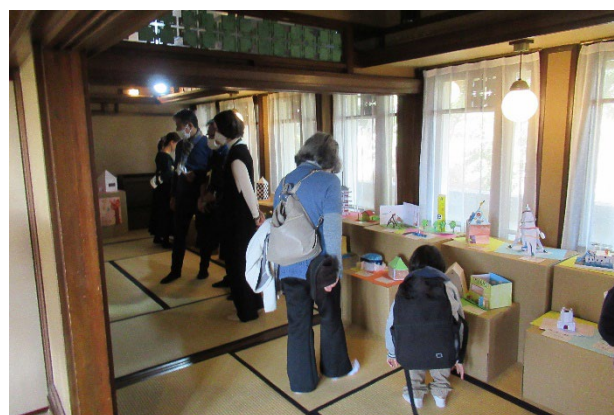
▲2022年11月 児童がヨドコウ迎賓館見学時に得た発想から制作した建築模型の作品展