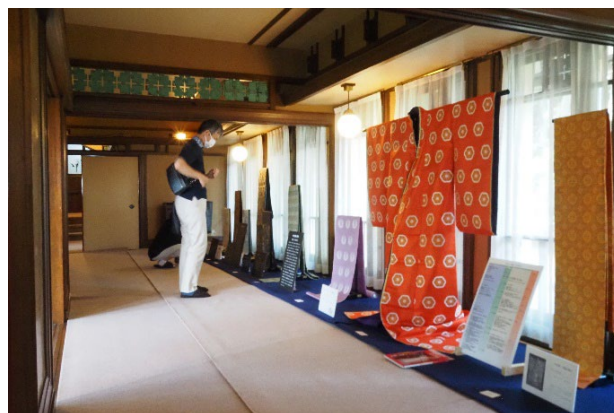
▲2022年10月 「HOS00展 ～1400年の時空を超えて～」