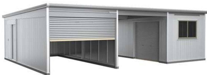
(豊富なオプションを組み合わせた連結タイプ)